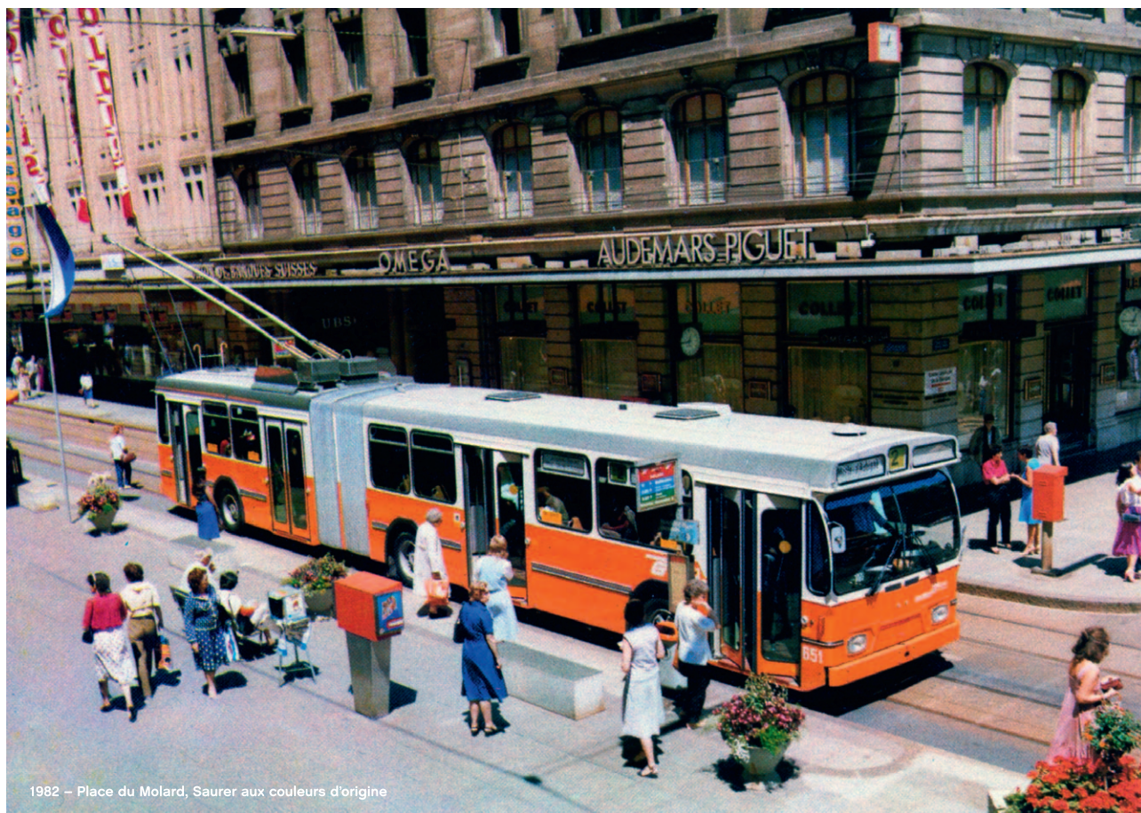
1982 - Place du Molard, Saurer aux couleurs d'origine