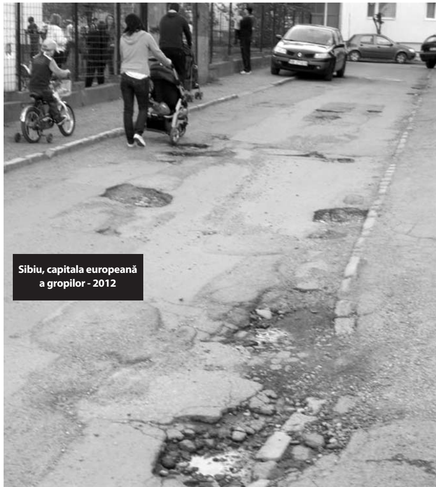
Sibiu, capitala europeană a gropilor - 2012

aterizărilor. Președintele Martin Bottesch are dosar de urmărire penală la DNA București, în „Afacerea Aeroportul” pentru abuz în serviciu contra intereselor publice (art. 248 și art. 248 indice 1 Cod penal).