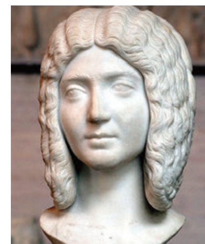
Iulia Domna și-a însoțit fiul, pe Caracalla, în Dacia