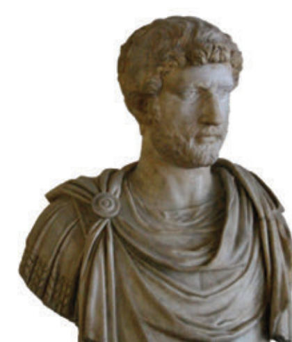
Împăratul Hadrian a vizitat Dacia în două rânduri