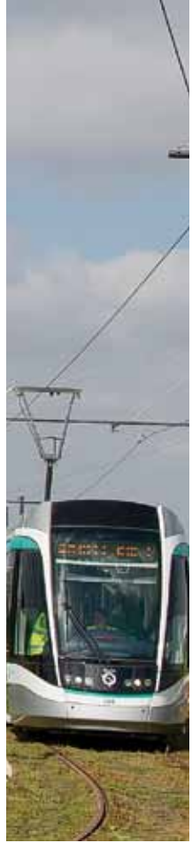
RATP - Denis Sutton

Comme une bonne nouvelle n'arrive jamais seule, la mise en service du T7 s'accompagne d'une restructuration des lignes de bus du secteur, à partir du 17 novembre. Concrètement, ce sont 19 lignes de bus modifiées afin de répondre plus précisément aux nouveaux besoins de circulation des voyageurs et renforcer la complémentarité du réseau bus avec le tramway. Un dépliant consacré à cette restructuration des bus est mis à votre disposition dans les lignes concernées et téléchargeable sur www.tramway7.fr .