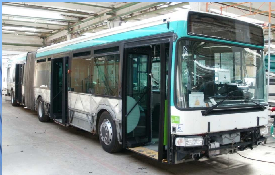
Autobuz diesel IRISBUS Agora Long