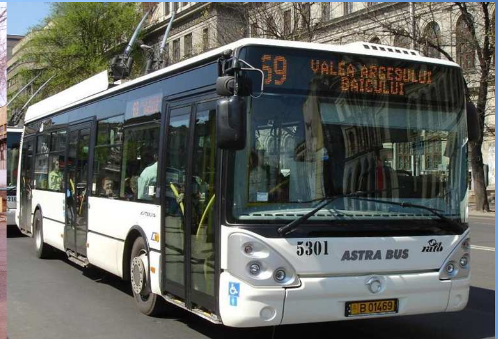
100 buc. ASTRA IRISBUS Bucuresti