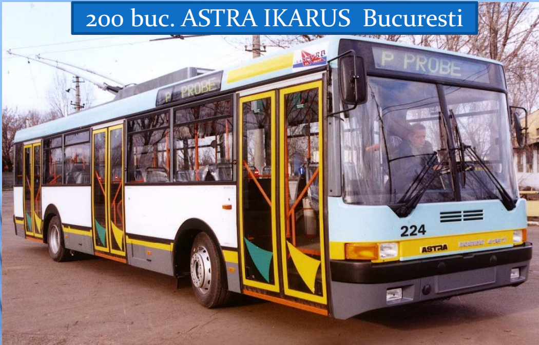
200 buc. ASTRA IKARUS Bucuresti