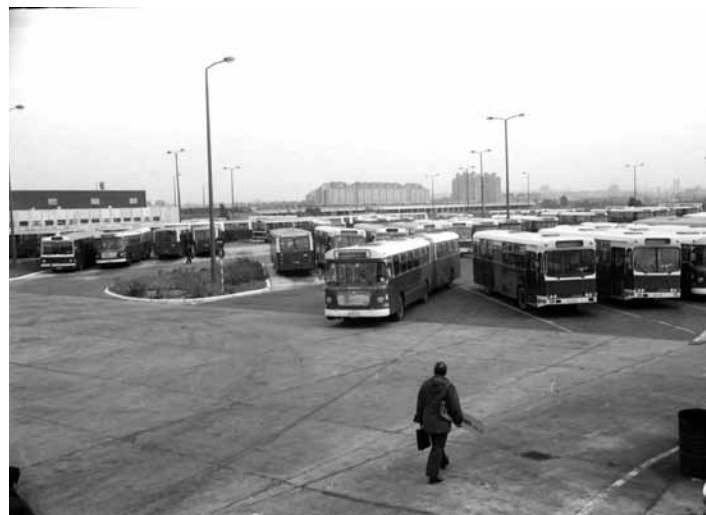
СП "НОВИ БЕОГРАД"