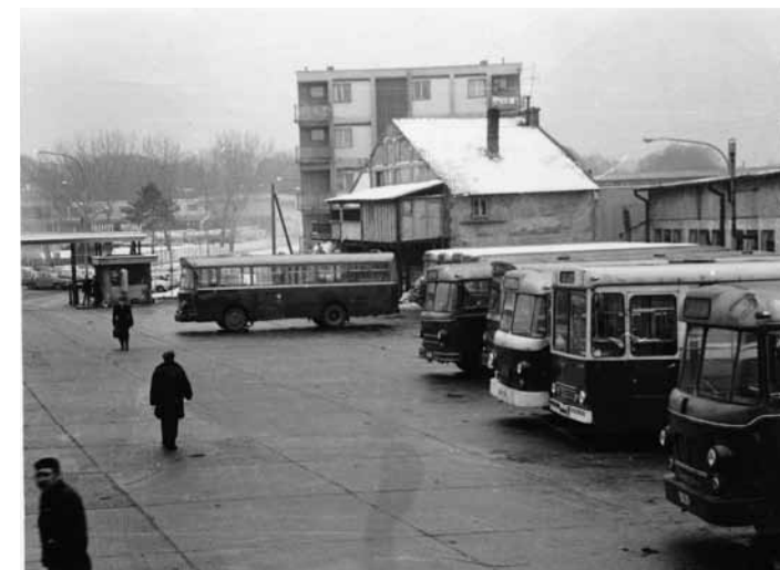
СТАРИ "КОСМАЈ" У МИЈЕ КОВАЧЕВИЋА