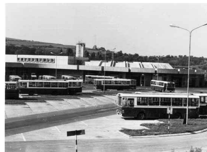
СП "КОСМАЈ" НА АУТОПУТУ