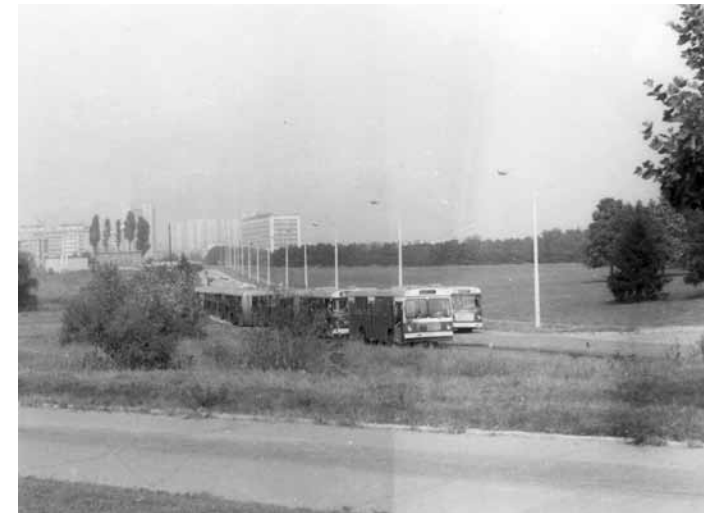
ПАРКИНГ КОД СИВА - У НЕДОСТАТКУ ПАРКИНГ ПРОСТОРА