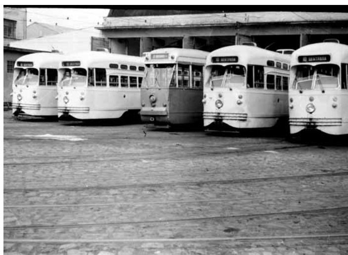
МИЛАНСКА БРЕДА У ДРУШТВУ БЕЛГИЈАНАЦА