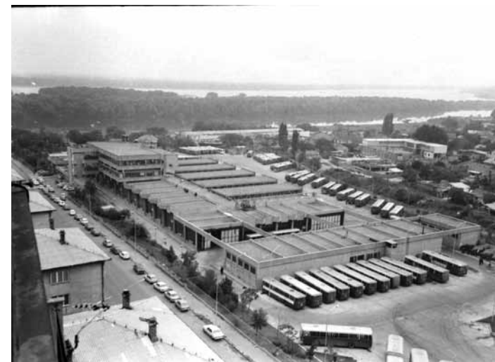
СП "КАРАБУРМА" - ПРВОБИТНИ ИЗГЛЕД