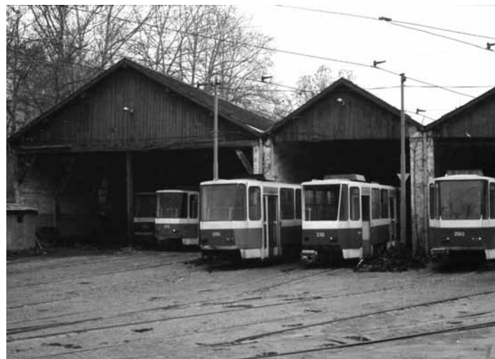
ГОРЊИ ДЕПО - НЕКАДАШЊЕ ТРАМВАЈСКЕ ШТАЛЕ