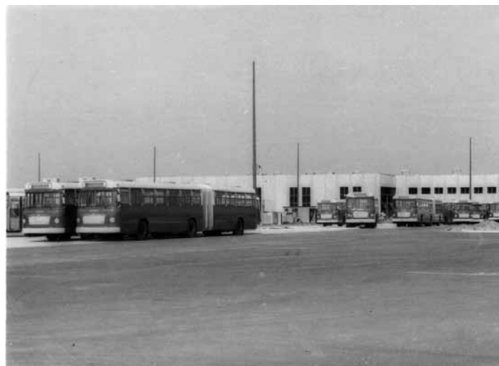
СП "НОВИ БЕОГРАД" - НОВИ АУТОБУСИ ЗА НОВИ ПОГОН