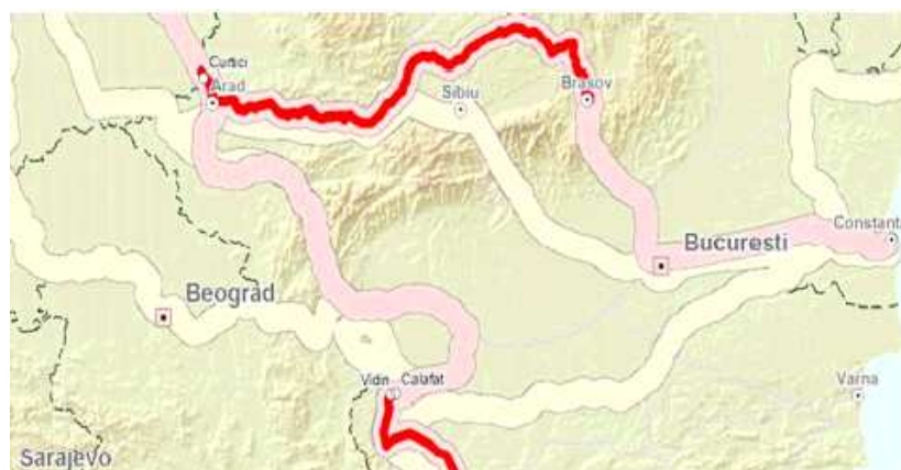
Fig. 5. Coridorul paneuropean (TEN-T) 4